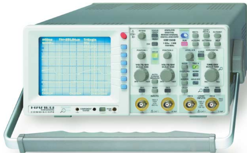
Bild 1: Ein Beispiel eines Analog-/Digital-Mixed-Signal-CombiScopes ist das 150-MHz-Oszilloskop HM1508 von Hameg.

Misst man ein Signal mit einem DSO, handelt es sich bei der Anzeige immer um eine mehr oder weniger gute, künstlich durch Interpolation nachbearbeitete Rekonstruktion (!) des Signals. Im Gegensatz dazu ist es bei Analoggeräten aus physikalischen Gründen ausgeschlossen, dass verzerrte, total verfälschte oder Phantomsignale angezeigt werden. Die Anzeige ist stets wahr und zuverlässig. Der Benutzer muss deshalb nicht wie bei DSOs das zu messende Signal bereits sehr gut kennen, um keinen Falschanzeigen zum Opfer zu fallen oder eine zwar im Prinzip richtige Anzeige im Geiste nachzukorrigieren. Bei einem Analoggerät muss man lediglich